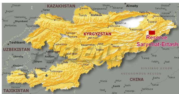
Localisation de la réserve, à l'est du pays

La réserve naturelle de Sarychat-Ertash, située au Kirghizistan, a été créée en 1995 pour protéger l'écosystème de haute altitude du Tian-Shan central. Elle recouvre une superficie de 134 140 hectares au sud-est du lac Issyk-Kul, le deuxième plus grand lac de montagne après le lac Titicaca (Pérou, Bolivie). Pour situer le décor, les plus hauts sommets des environs culminent à près de 5200 mètres. La réserve abrite plusieurs espèces menacées telles que le léopard des neiges ( Uncia uncia ), le mouflon de Marco Polo ( Ovis ammon polii ) ou encore le chat de Pallas ( Otocolobus manul ). Depuis 2008, l'organisation International Snow Leopard Trust mène un programme de protection des panthères des neiges au sein de cette réserve.