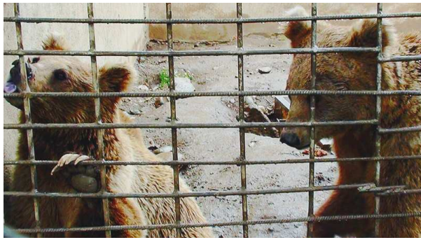
Ours en cage dans le zoo de Karakol

L'AFKE travaille avec l'INES pour rechercher les fonds nécessaires à la mise en place du projet qui doivent compléter ceux déjà accordés par la Mairie de Bichkek.