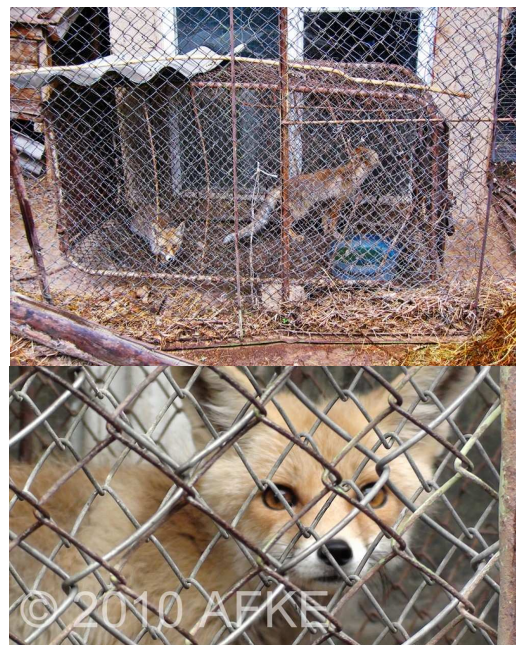
Renards du zoo de Karakol dans une bien triste cage